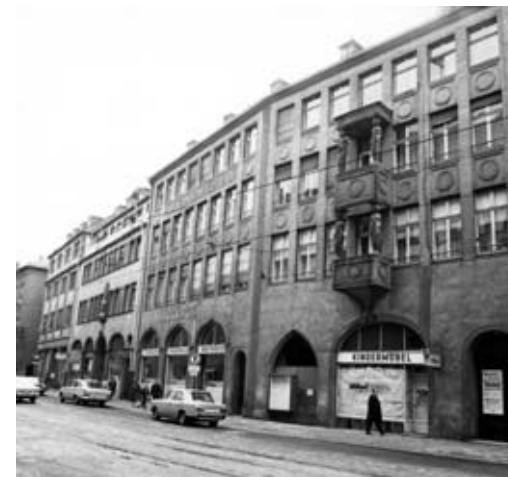
5 vor 1970