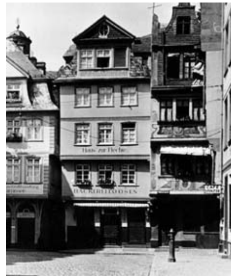
6 ca. 1930