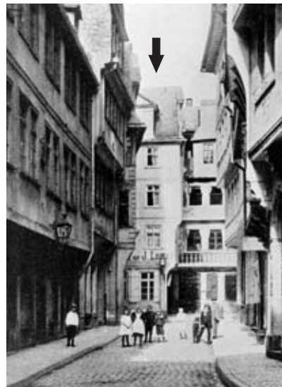
5 ca. 1910