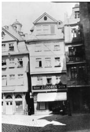
4 ca. 1920