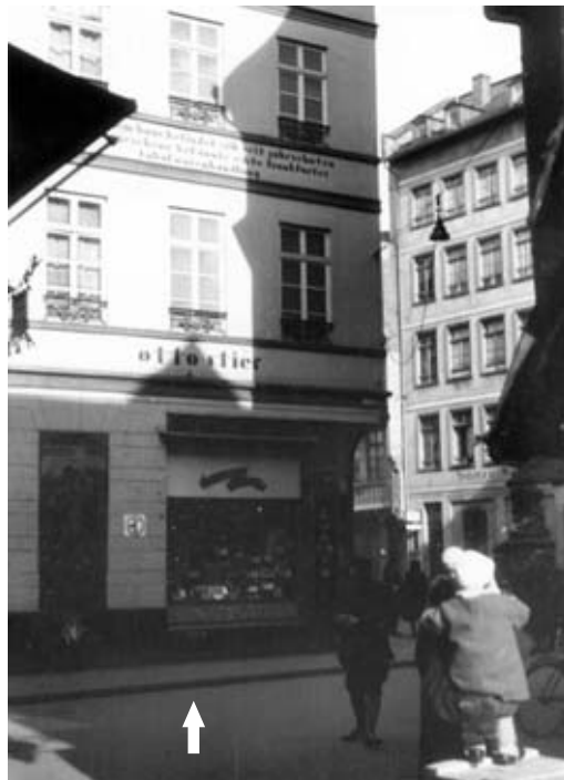
4 ca. 1930