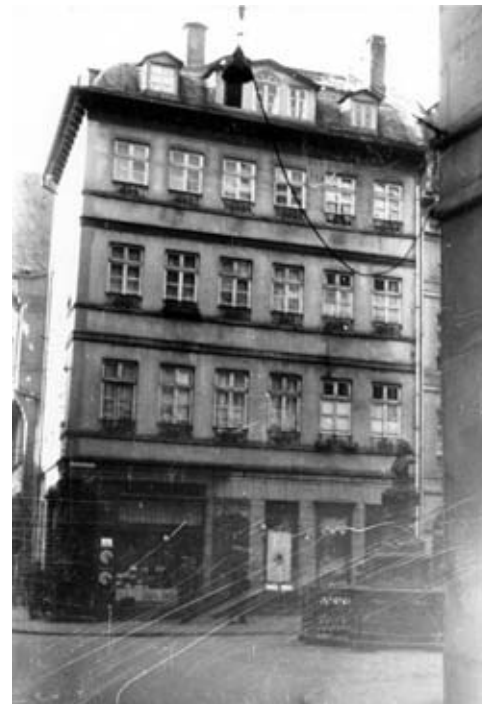
5 ca. 1930