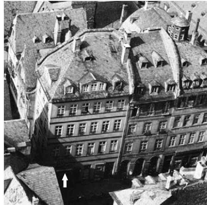
3 ca. 1930