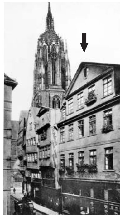
4 ca. 1900