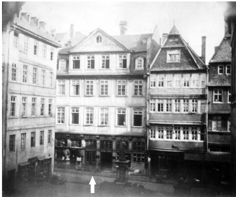
3 ca. 1860